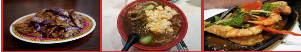
1. Aubergines sautées aux viandes séchées